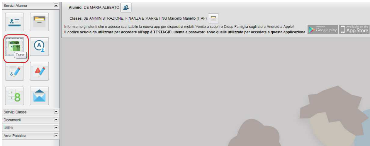
(accesso ai servizi di pagamento)

Il servizio di pagamento delle tasse e dei contributi scolastici è integrato all'interno di Scuolanext - Famiglia, ed è richiamabile tramite il menù dei Servizi dell'Alunno .